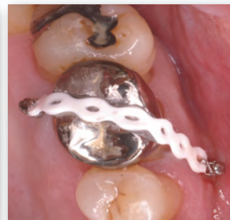
上顎第一大臼歯の圧下